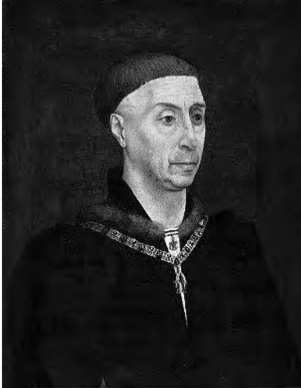
Rogier van der Weyden(? of Jan van Eyck) (kopie), Portret van Philips de Goede Antwerpen, koninklijk Museum voor Schone Kunsten.