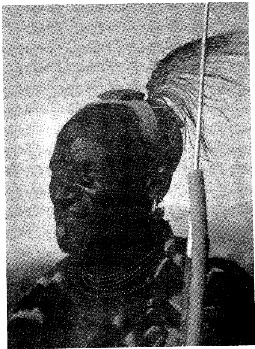
Traditionele Turkana-herder, getooid met lipsieraad, ooringen en klei-kapsel. Kenia 1987.