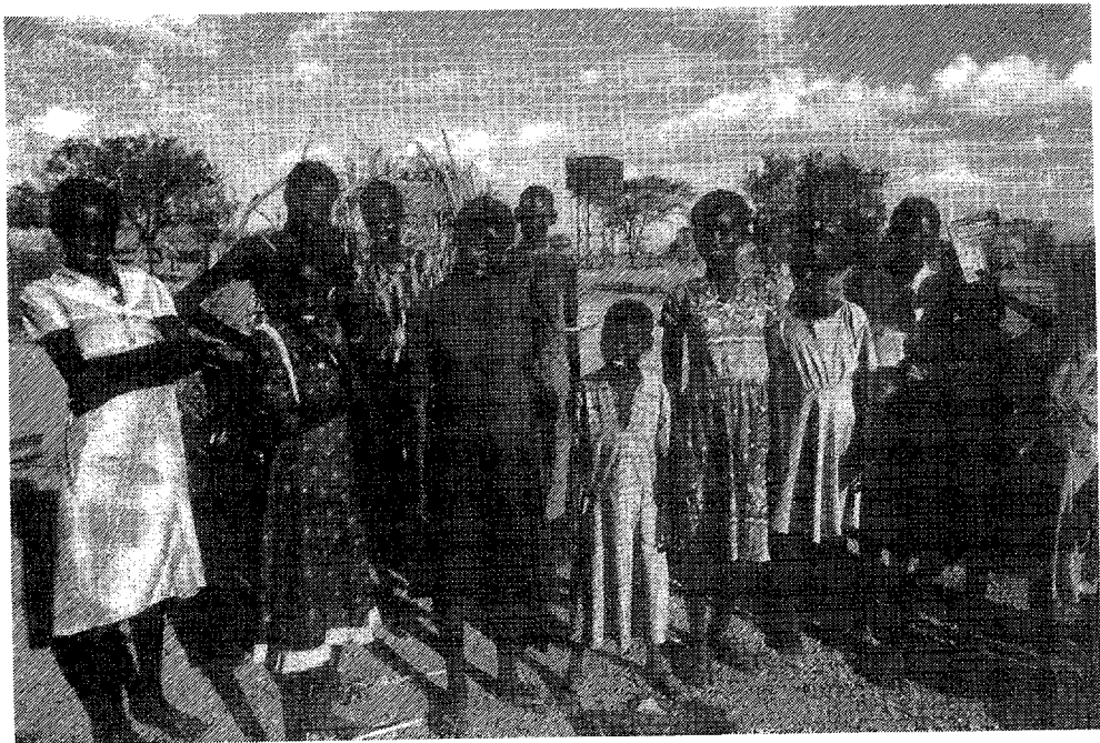
Turkana-gezin dat zich bij een missiepost gevestigd heeft en voor een groot deel daarvan afhankelijk is.