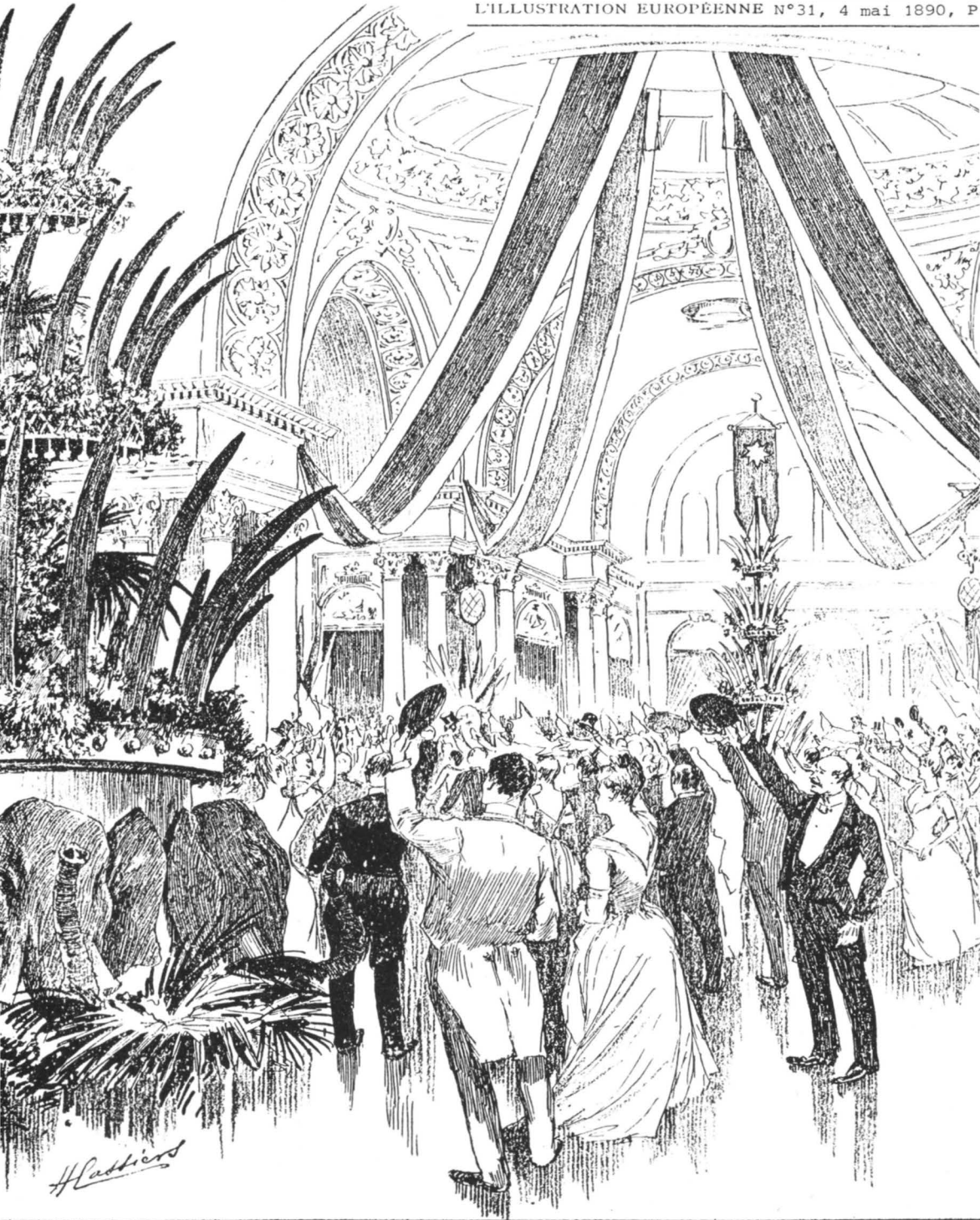
FÊTE DU PALAIS DE LA BOURSE DE BRUXELLES. OVATION FAITE AU ROI LORS DE LA REMISE DE L'ADRESSE EN FAVEUR DU CONGO