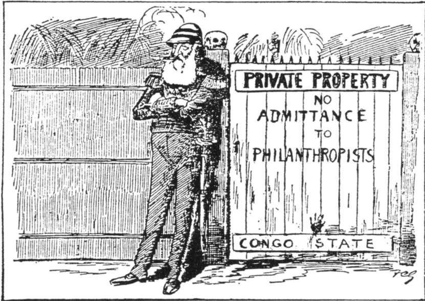
Uit : Picture-Politics , London, July 1906.